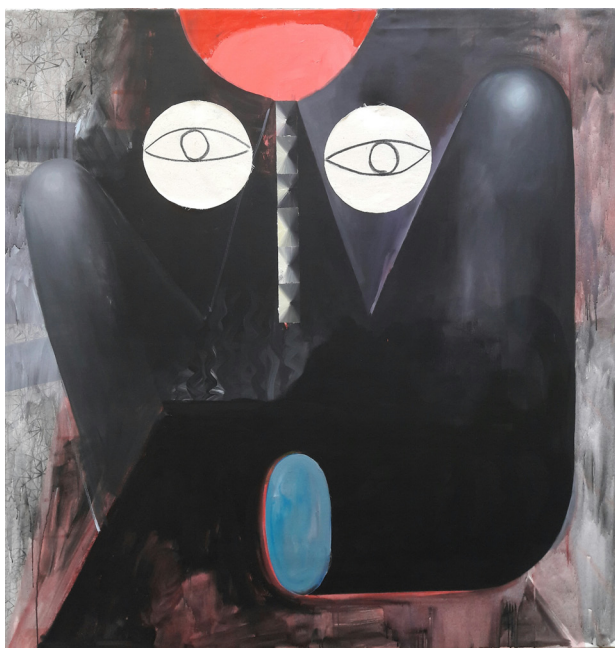
Witwe, 2017, akryl a textil na plátně na plátně