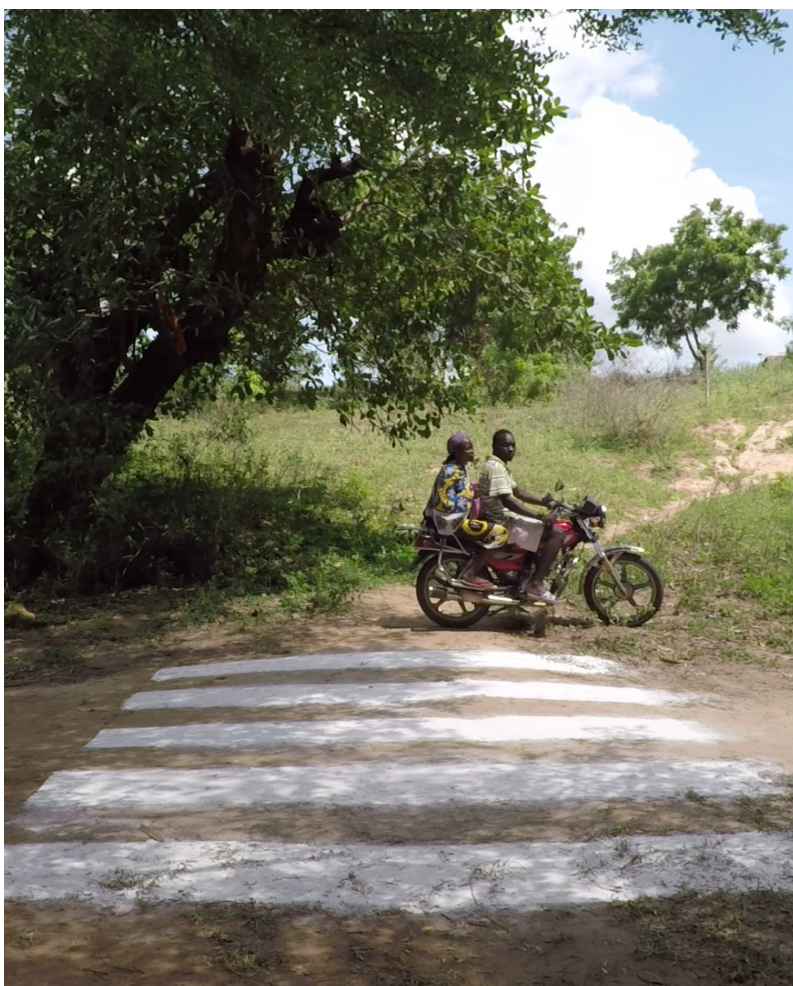
Nepatříčná pravidla, 2018, video 12:00

Kontakt pro média: Národní kulturní památka Vyšehrad MgA. Bohdana Kolenová propagace, PR T.: +420 606 937 057 e-mail: kolenova@praha-vysehrad.cz