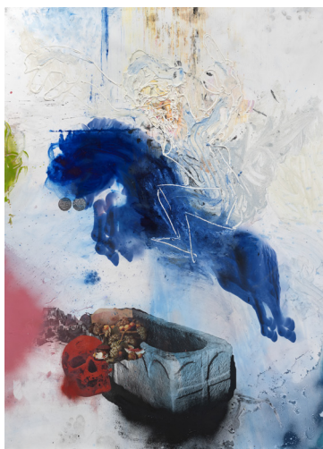
Schemik & Horymír, kombinovaná technika na plátně, 140x 100 cm, 2020